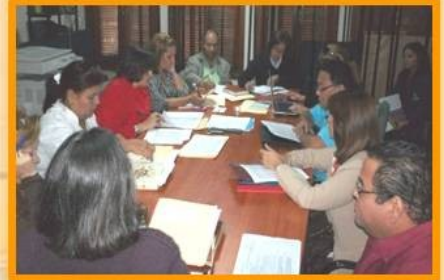
Miembros del CDCHT